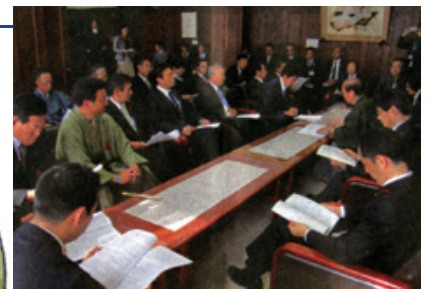
自民党京都市議員団から市長へ要望