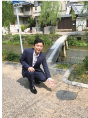
▲ご覧の通り凹凸です。